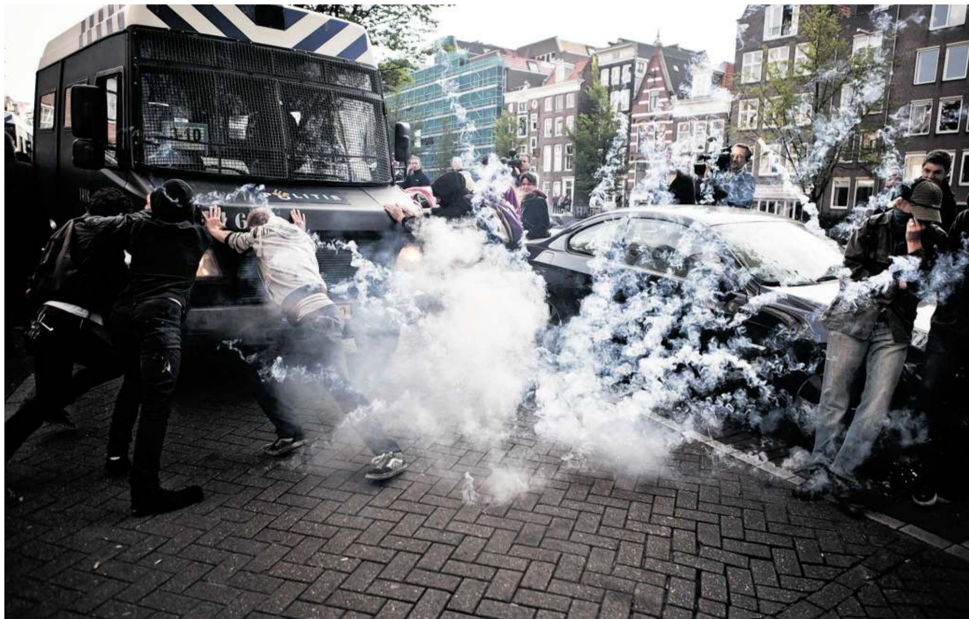
De ME stuit op verzet bij het ontruimen van kraakpand Schijnheilig aan de Passeerdersgracht in Amsterdam.

De Amsterdamse politie ontruimde dinsdag negen kraakpanden. Bij krakersbolwerk Schijnheilig werden 150 arrestaties verricht. Verslaggever Joost de Vries maakte de ontruiming mee met de bewoners van Schijnheilig, collega Noël van Bommel zat in de commandowagen van de commissaris.