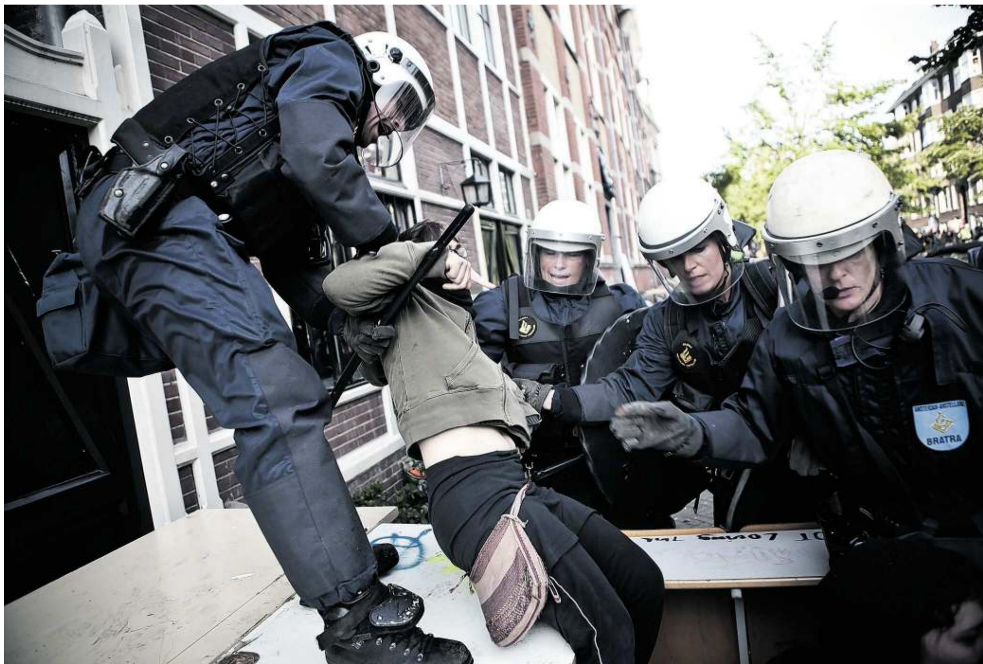
Krakers worden afgevoerd terwijl ze zich verzetten tegen de ontruiming van het kraakpand Schijnheilig aan de Passeerdersgracht in Amsterdam.